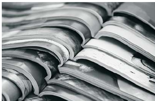
Existen tres grandes rubros donde agrupar a las revistas: negocios, noticias y consumidores.

Las revistas de "noticias" están dirigidas a un amplio segmento de lectores, usualmente se publican semanalmente. Están elaboradas para ofrecer al usuario una sola fuente de consulta acerca de noticias, eventos y acontecimientos, los contenidos están creados por expertos y personalidades de prestigio, están disponibles en tiendas y también a través de suscripciones. La publicidad que muestran regularmente abarca un amplio espectro de anunciantes.