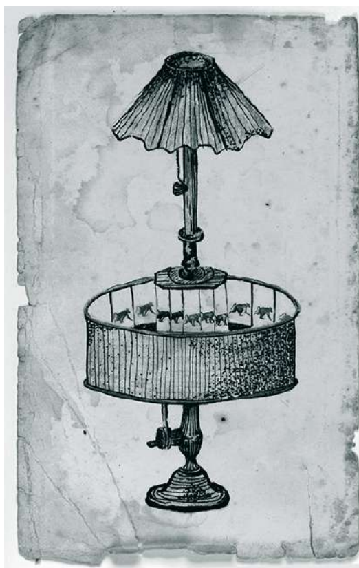
Emil Reynaud en 1877 creó el praxinoscopio, en donde se logra hacer toda una serie de dibujos que crean una historia en movimiento.

Pierrot) el cual logró ser todo un espectáculo en esos tiempos. Gracias al descubrimiento de la fotografía se pudieron despejar algunas incógnitas con respecto al movimiento, la primera incógnita resuelta fue debido a una apuesta que a finales de 1800 les surge a los magnates aficionados de carreras de caballos en Palo Alto. Ellos se preguntaron sobre el recorrido de los caballos y si estos flotaban sus cuatro patas a la hora de trotar, para esto, el se-